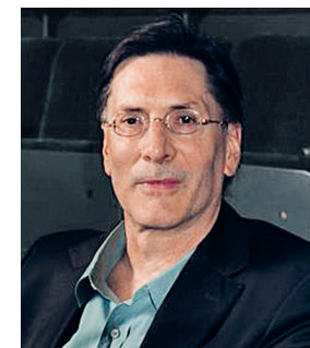
2019 GEORGE STEINMETZ