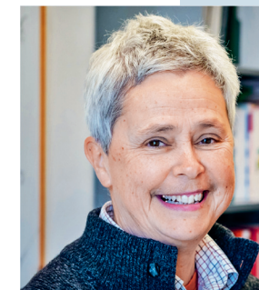
2020 ISABEL V. HULL