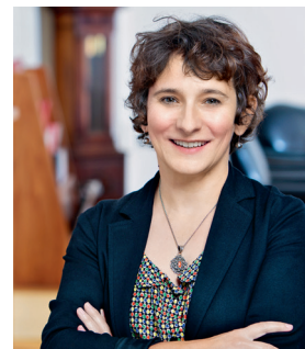
2021 MARION FOURCADE